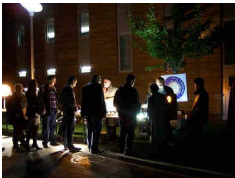
A VTT bemutatója a Millenáris park szabad területén