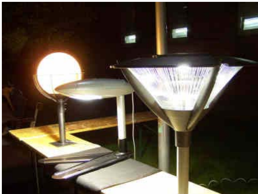
Korszerű közvilágítási lámpatestek kiállítása