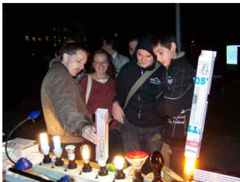
Ismerkedés a különféle fényforrásokkal